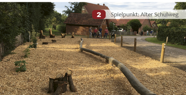
2 Spielpunkt: Alter Schulweg