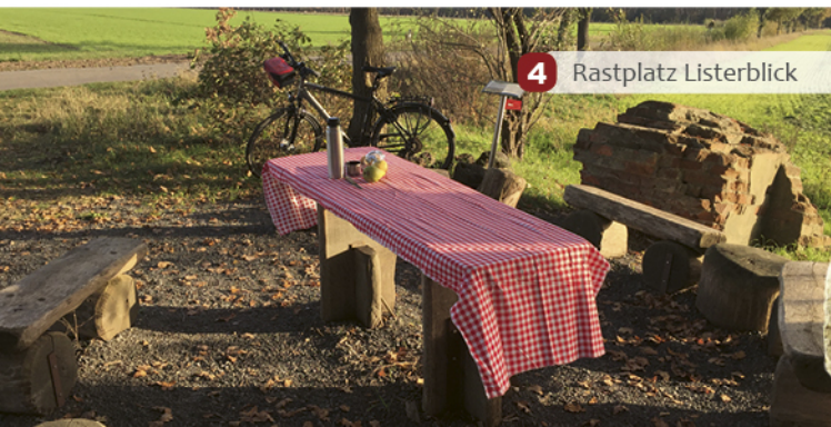
4 Rastplatz Listerblick